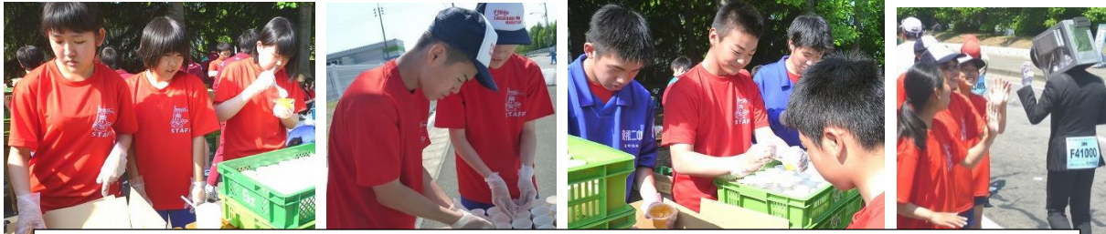
東根市の特産品・エイド係を担当。ランナーの栄養補給用、特産ゼリーやジュースを渡して応援しました。

約30℃の気温の中、ランナーを歓迎するために29名の中学生ボランティアが大活躍しました。