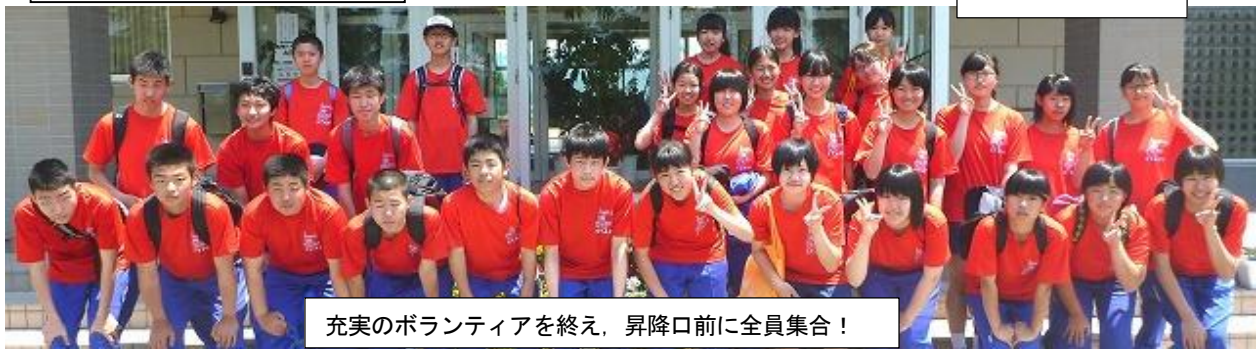
充実のボランティアを終え、昇降口前に全員集合！

僕は、やさしさの大切さを感じました。ゴミ回収の時、ランナーの方がゴミ袋に入らなかったゴミをわざわざ拾って袋に入れてくれました。僕もそんな人になりたいと思いました。