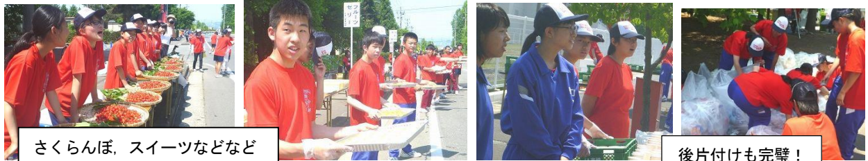
さくらんぼ、スイーツなどなど